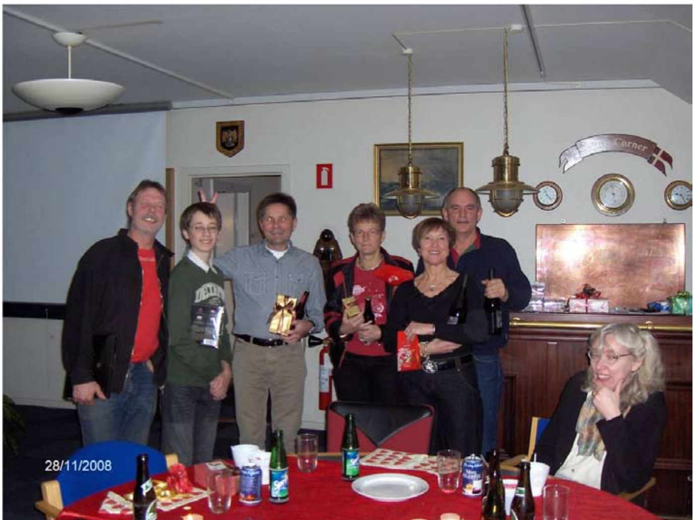
Deltagerne i Juleturneringen