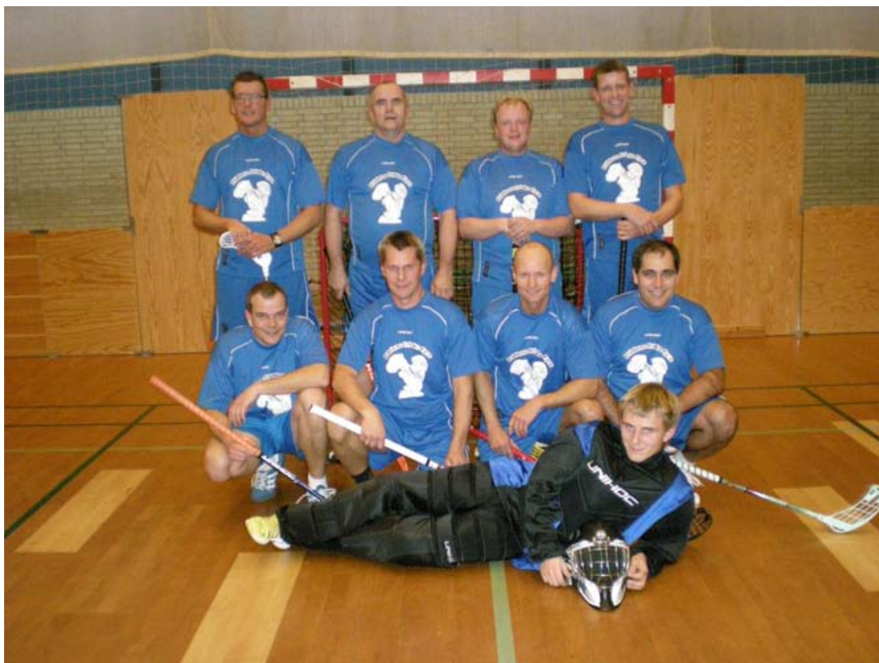
SFFK Firmahold - "Flådens Friske Fyre".

Den nyligt oprettede floorball klub under SIF i Frederikshavn, Søværnets Frederikshavn Floorball Klub (SFFK) spillede 28. november deres første kamp i Nordjysk Firma Cup 2008/2009. Holdet, som går under navnet "Flådens Friske Fyre", mødte i den første kamp "Team Viktor", og efter en chokstart, hvor holdet kom bagud 0 – 3 efter 5 minutters spil, strammede holdet sig an, og vandt med resultatet 6 – 5 efter de 2 x 20 minutters spilletid.